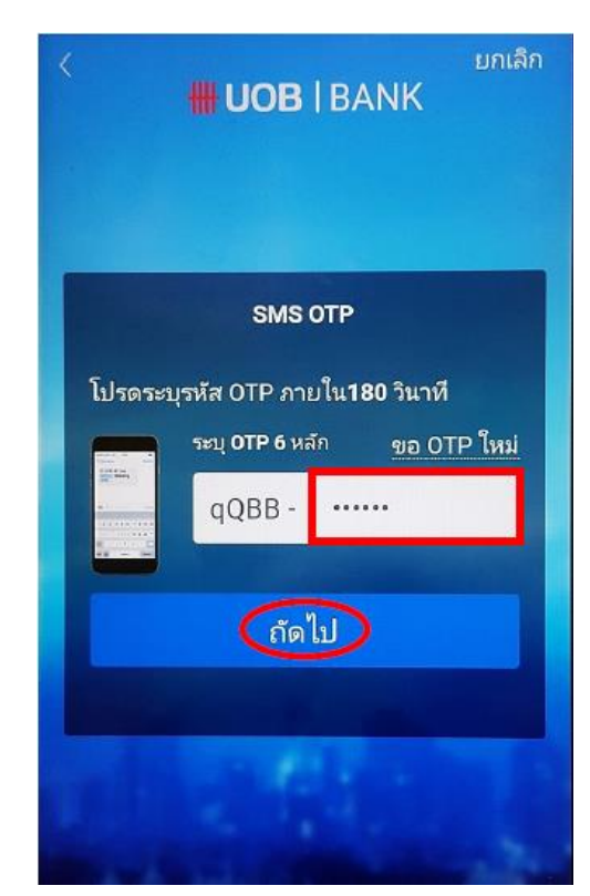
ระบุรหัส OTP ที่ได้รับทาง SMS จากนั้น กดปุ่ม "ถัดไป"