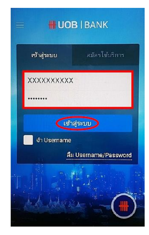
3. ระบุ รหัสประจำตัว (User ID) และ รหัสผ่าน (Password) แล้วกดปุ่ม "เข้าสู่ระบบ"