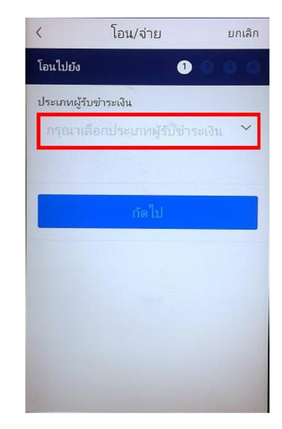
9. เลือก "กรุณาเลือกประเภทผู้ชำระเงิน"