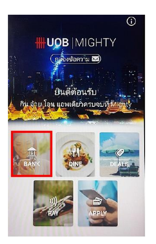
2. เลือก "BANK"

1. เปิด Application "UOB Mighty Thailand"