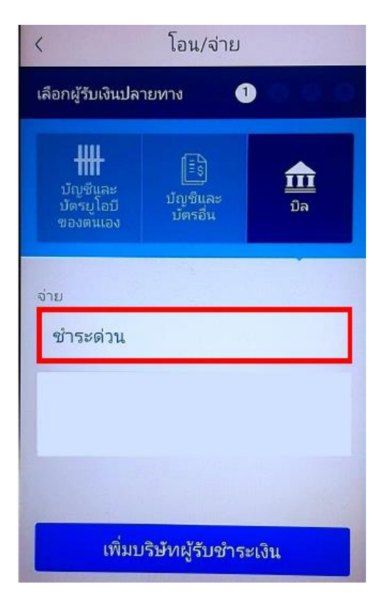
8. เลือก "ชำระด่วน"